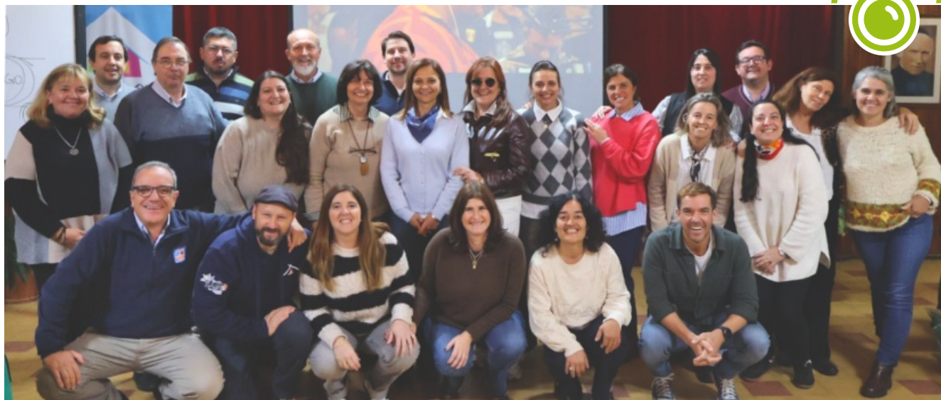
Encuentro de Consejos de Dirección de las Obras y Comisiones Directivas de las Cooperativas - Uruguay (Colegio Sagrada Familia de Montevideo, 8 de mayo)