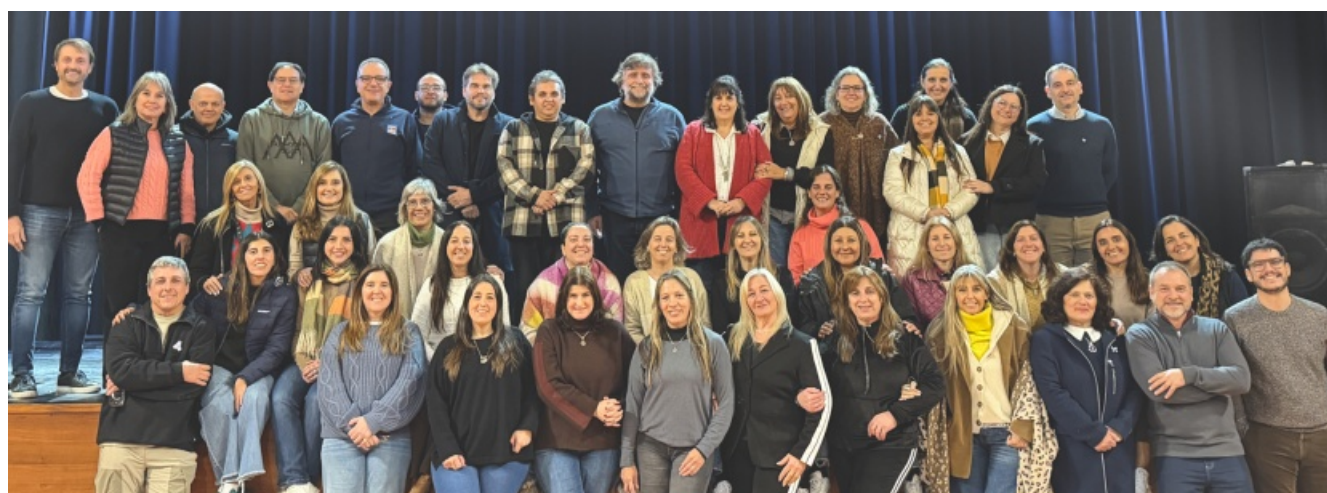
Encuentro de Directivos de la Asociación Sagrada Familia (Argentina) (Colegio San José, Tandil, 21 y 22 de mayo)