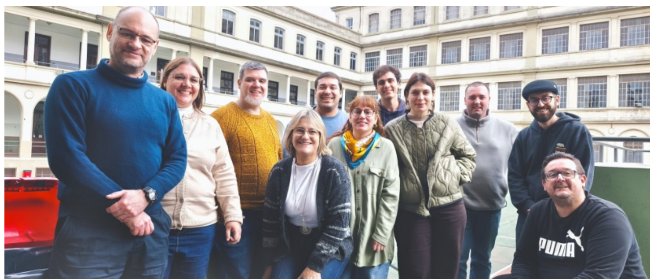
Encuentro de la red de comunicación Sa-Fa Uruguay (Colegio Sagrada Familia de Montevideo, 16 de mayo)