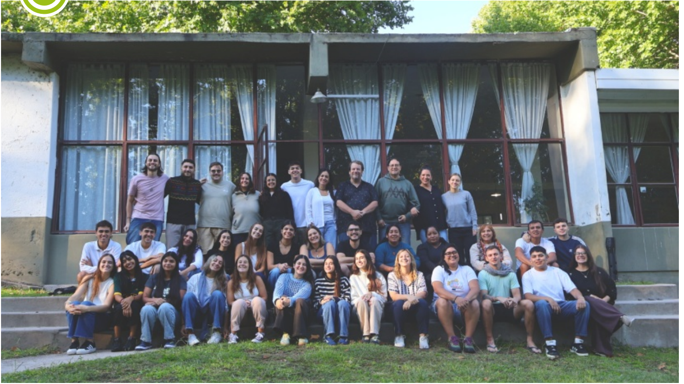
Asamblea de la Pastoral Juvenil - Argentina (Villa Sagrada Familia, Córdoba, 14 y 15 de marzo)