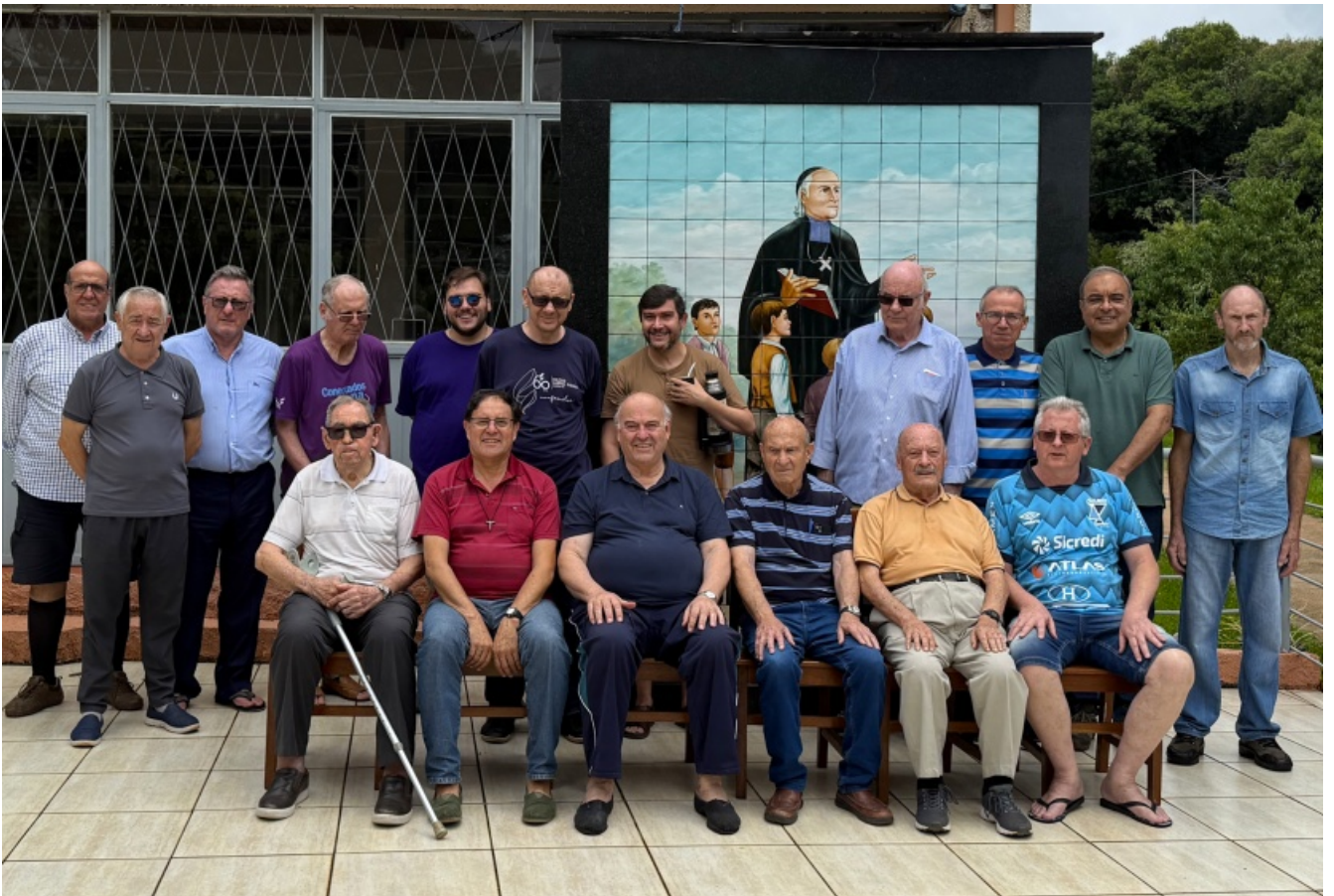
Retiro y Convivencia de los Hermanos de la Provincia (Passo Fundo, Brasil, 4 al 11 de enero)