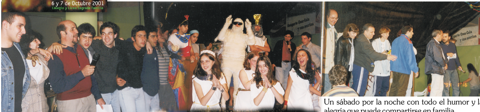
Un sábado por la noche con todo el humor y la alegría que puede compartirse en familia.

Una que nos permite sentir que la esperanza debe estar siempre presente, y lo que parece imposible juntos podemos hacerlo.