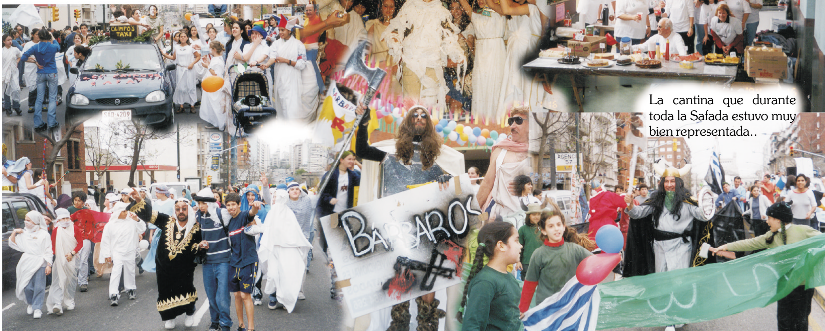
La cantina que durante toda la Safada estuvo muy bien representada..

Una que nos permite sentir que la esperanza debe estar siempre presente, y lo que parece imposible juntos podemos hacerlo.